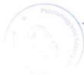
Balázs Henriett polgármester