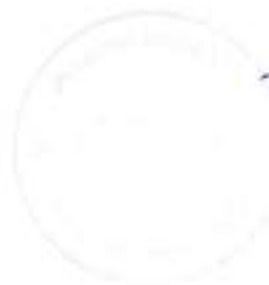
Balázs Henriett polgármester