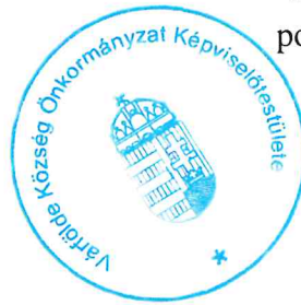
Tóth Árpád polgármester